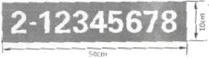
图 1 非道路移动机械环保金属标牌样式