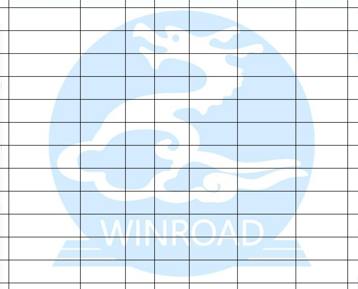
承包人用于本工程施工的机械设备表