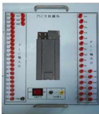
图 2 PLC 挂箱示意图

⑧挂箱 PLC 主机所有输入输出端口引出至插线端子。插座及 PLC 主机分布如图 2 所示。