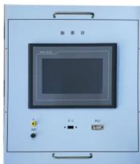
图 4 触摸屏挂箱示意图