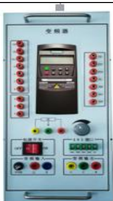
图 3 变频器挂箱示意图